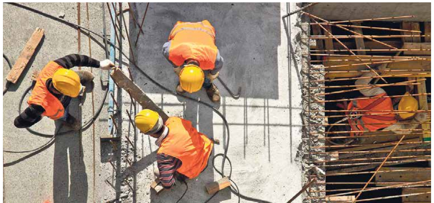
A pesar de que en el mundo obrero se sigue sustentando la economía, miles de personas no disponen de un trabajo decente.

“ Un cristiano no puede tolerar que haya desigualdad, por lo que debe luchar para acabar con ella