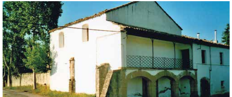
Ermita de Nuestra Señora de la Victoria. Jaca.

Delante de este, marcha uno de sus individuos, vistiendo rico traje de seda color carmesí, en recuerdo del antiguo derecho de Senadores, y en representación del Prior de veinticuatro, que era el cargo preeminente de la ciudad. Lleva un estandarte con las armas de las cabezas de los cuatro reyes moros, en la cruz jaquesa, rodeadas de la siguiente inscripción, en caracteres dorados. Christus vincit, Christus imperat, Christus regnat, Christus ab