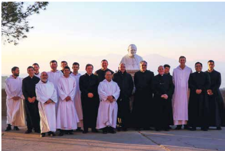
La comunidad recibe a los fieles y visitantes con gran hospitalidad.

A 600 metros sobre el nivel del mar, dominado el suave Somontano, se yergue a las puertas de Barbastro una roca de piedra caliza en la que hace más de novecientos años la Virgen pidió al pastor Balandrán que la ciudad le levantara una capilla. Nació así el Santuario del Pueyo, una atalaya con vistas privilegiadas, lugar de peregrinación y devoción ancestral, donde hace una década se instalaron los monjes del Instituto del Verbo Encarnado, congregación de origen argentino que acaba de cumplir 35 años.