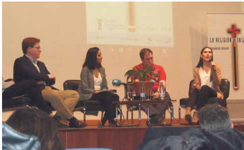
La campaña fue presentada el 29 de marzo en el encuentro regional de Enseñanza.

En concreto, el decálogo indica que esta asignatura ayuda a comprender y amar por igual a todos los hombres y