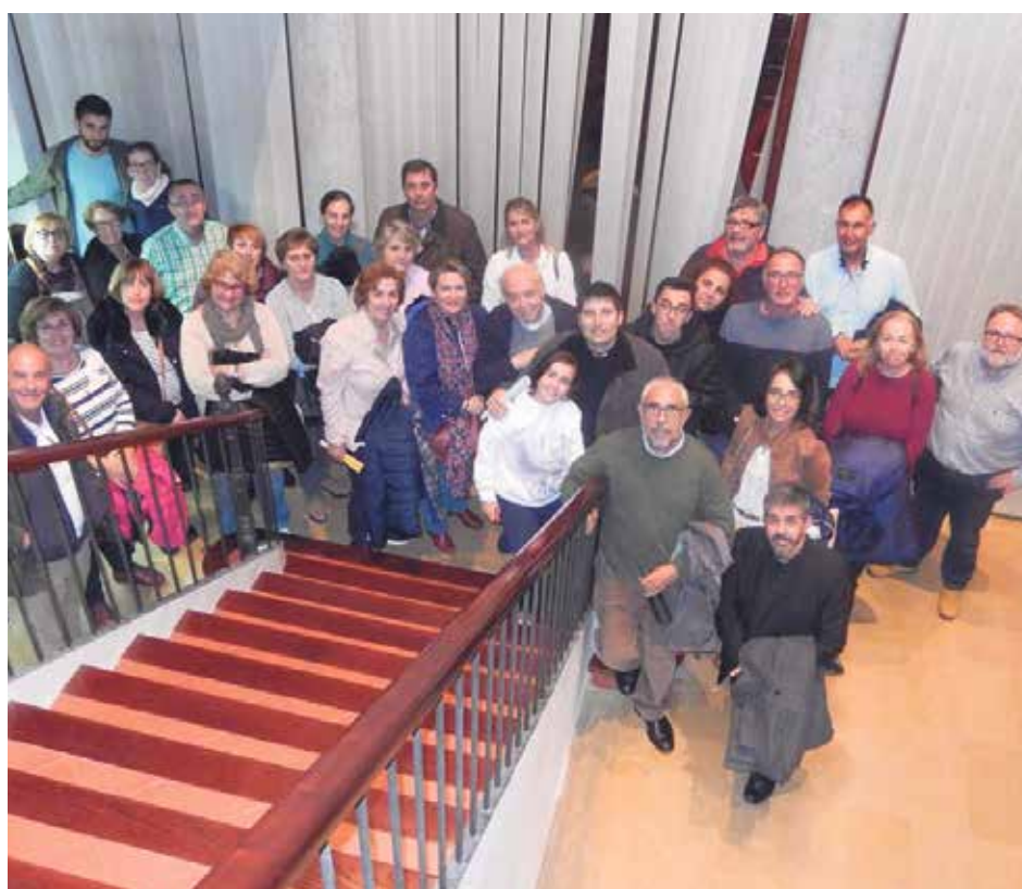
Algunos de los 180 asistentes a las jornadas.