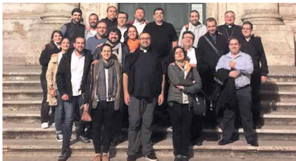
El Consejo Nacional de Pastoral Juvenil de la Conferencia Episcopal, en Roma.

Impresionan los gestos del papa Francisco. Estuvo presente en todas las sesiones: tres horas y media por la mañana y las mismas por la tarde. En la merienda se mezclaba con nosotros y hablábamos.