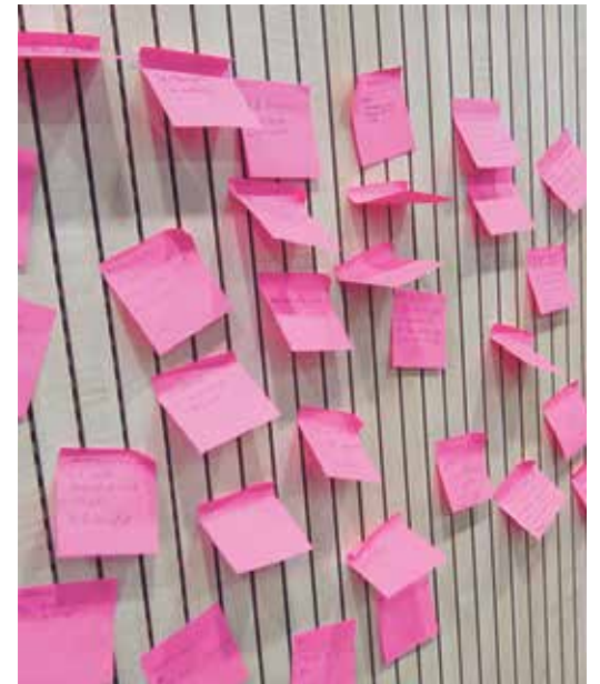
Las dinámicas de trabajo fueron variadas.

El CRETA es un centro teológico con casi 50 años de historia al servicio de Aragón. Es una institución agregada de la Universidad Pontificia de Salamanca y ofrece estudios de