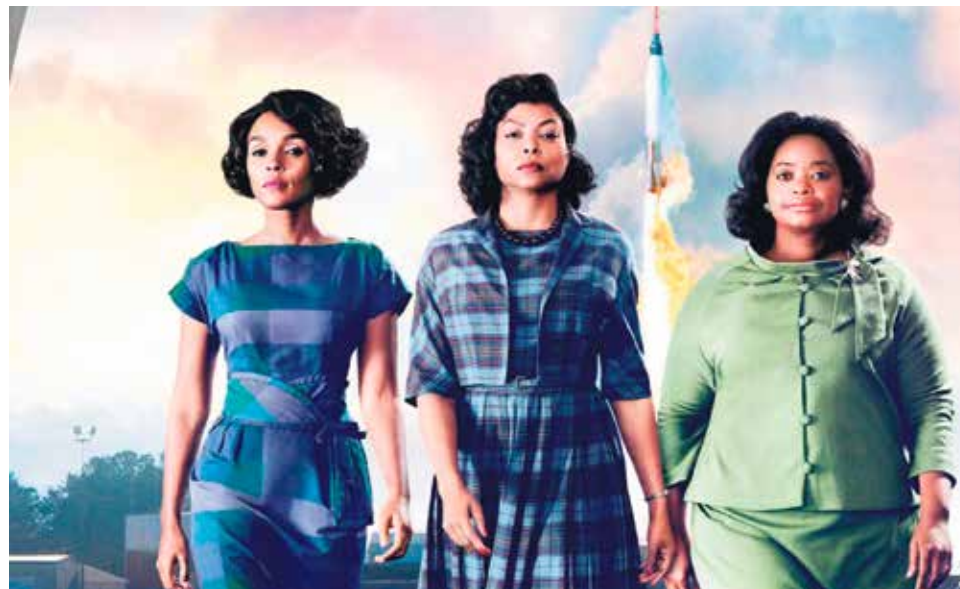
La primera película será 'Figuras ocultas'.

Antes y después de la proyección, el presentador de cada película ofrecerá