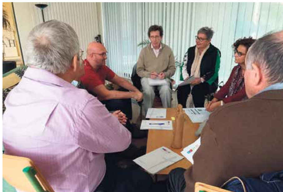
Los grupos de trabajo facilitaron la participación.

La formación online empieza su andadura en este centro con este