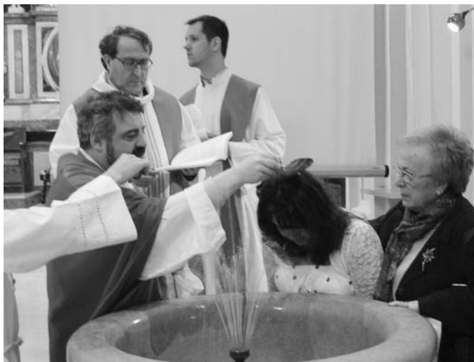
Bautismo de adultos en Ntra. Sra. del Portillo

El pasado mes de marzo, en la Basílica del Pilar, en la Eucaristía del Cuarto Domingo de Cuaresma tuvo