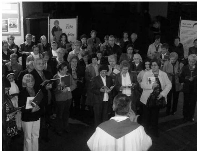
Los catequistas, en San Pablo de Zaragoza.